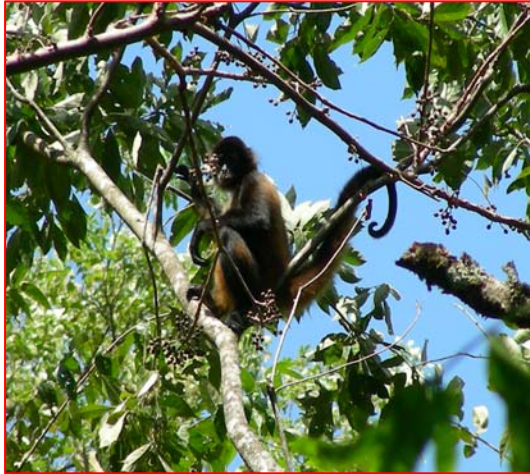
Fig. 1. Primera foto tomada al mono charao o mono araña de Azuero ( Ateles geoffroyi azuerensis ), La Miel-Las Tablas, Península de Azuero, Panamá.